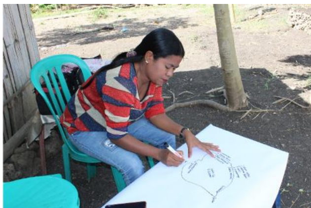
Figura 1. Estensionista suku halo mapamentu hamutuk ho grupu to'os-na'in fetu sira.

EA nia área responsabilidade mak iha suku Balibo Vila, postu administrativu Balibo, munisípiu Bobonaro. Nia responsabiliza ba grupu fetu haat iha aldeia haat iha suku Balibo Vila, kada grupu iha membru na'in 12-16. Antes implementa atividade pilotu ne'e estensionista hala'o nia knaar hanesan baibain, forma grupu to'os-na'in envolve fetu no mane iha grupu no fó assisténsia ba sira. Bainhira halo selesaun ba suku ne'ebé possibilidade atu implementa pilotu ne'e, suku Balibo Vila mak bele prienxe kriteria hanesan tenke estensionista fetu no iha grupu to'os-na'in fetu sira. Estensionista relata katak antes ne'e nia grupu to'os-na'in sira kahur fetu ho mane maibé bainhira implementa pilotu ne'e, nia foka liu ba to'os-na'in fetu sira ne'ebé forma ona iha grupu.