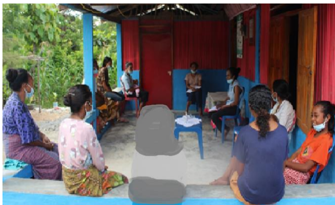
Figura 2. Enkontru ho estensionista, ofisial projetu TOMAK ho grupu feto to'os-na'in sira

To'os-na'in feto sira relata katak sira nia EA sai hanesan fonte informasaun prinsipál ba sira. Jeralmente to'os-na'in sira relata katak, sira rona informasaun dalabarak liu husi estensionista suku, dalaruma de'it mak rona husi xefe aldeia. Informasaun ne'ebé rona husi xefe aldeia mak hanesan informasaun jerál husi ONG deservimentu balun nomós husi governu lokál/xefe suku. Informasaun husi EA mak hanesan atividade implementa husi ONG ka ajénsia balun ne'ebé koopera ho MAP hanesan TOMAK, SAPIP, Avansa no seluk tan. To'os-na'in sira relata katak bainhira iha atividade ruma iha aldeia, estensionista mak mai fó hatene iha xefe grupu mak xefe grupu fó hatene ba membru sira. Grupú to'os-na'in rua mak nia lokalizasaun dook husi suku no dook husi estensionista, aleinde ne'e grupu ida seluk maski besik iha suku, sira mós asesu informasaun liu husi estensionista.